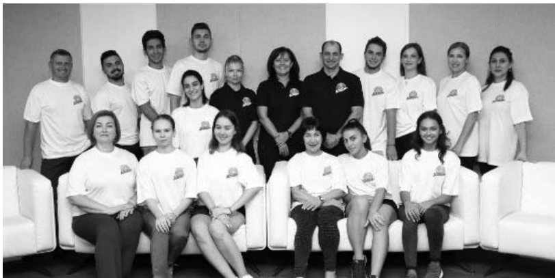
FIG Akademiyasının aerobika gimnastikası üzrə məşqçilik kurslarının nəticələri açıqlandı

Qeyd etməyə dəyər ki, ölkədə idmana göstərilən xüsusi diqqət və qayğının təzahürü kimi, bu gün irimiqyaslı beynəlxalq gimnastika yarışlarının Azərbaycanda təşkili idman növlərinin inkışafında böyük rol oynayır və həmçinin idman turizminin irəliləməsində də müsbət təsiri müşahidə olunur.